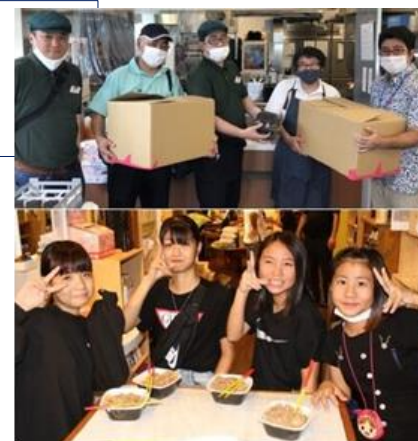
吉野家からの牛丼無償提供