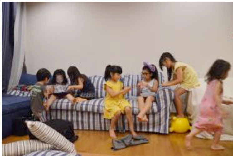
シングルマザーシェアハウスの風景