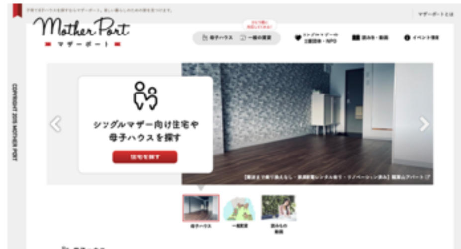
母子ハウス専用不動産ポータルサイト『マザーポート』